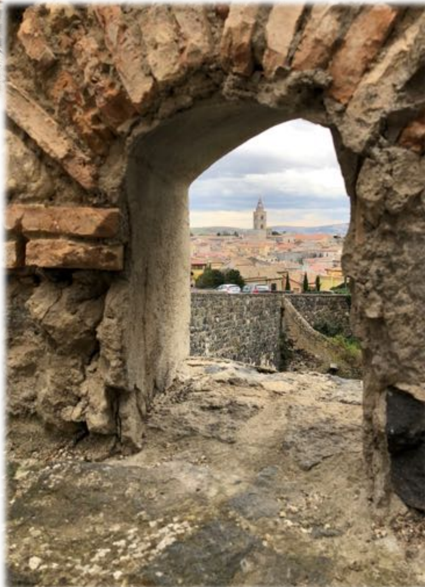
vista del paesaggio